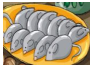
souris / araignée