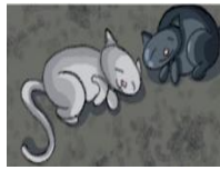
lapin / chat