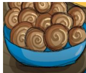
escargot / souris

3- Rappelez-vous les nombres en français ? Regardez la vidéo pour vous rappeler comment on dit les nombres en français.