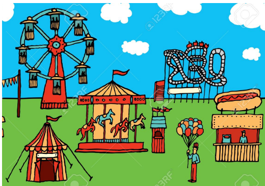
Le parc d'attractions

(39 o atividade : O que tem perto de sua casa ? Circule as imagens.)