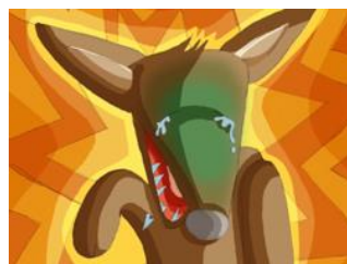
IL SE CASSA une dent