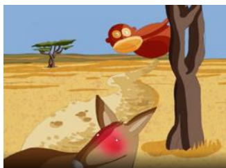
IL ÉTAIT rouge de honte

Activité 3 : observe attentivement les images. Regarde et écoute la suite de l'histoire. Numérote les images pour retrouver la chronologie de l'histoire « La souris et le chacal ».