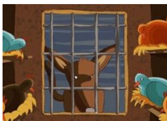
IL ENTRA dans le poulailler