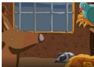
Une souris ARRIVA